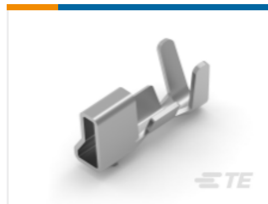
TE 零件编号 179610-1 AMP CT CRIMP-2 REC CONT. L/P