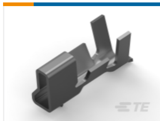
TE 零件编号 179227-1 CRIMP TYPE II REC CONTACT