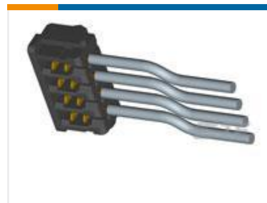
TE 零件编号 3-179694-0 2MM CT MT REC ASSY 10P GRAY