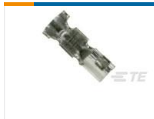
TE 零件编号 179227-4 AMP CT CRIMP-2 REC CONT AU